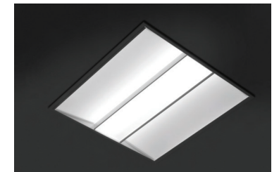
LICHTVERTEILUNGSKURVE 36 Watt (6030.3640.MPO.81)