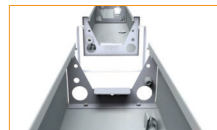
Verbindung einzelner Leuchten zu einem Lichtband